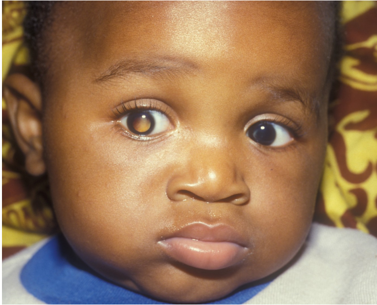
Fig 7 : Rétinoblastome œil droit.