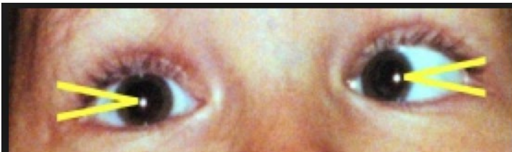
Fig 2 : Strabisme. Reflet cornéen excentré œil gauche.