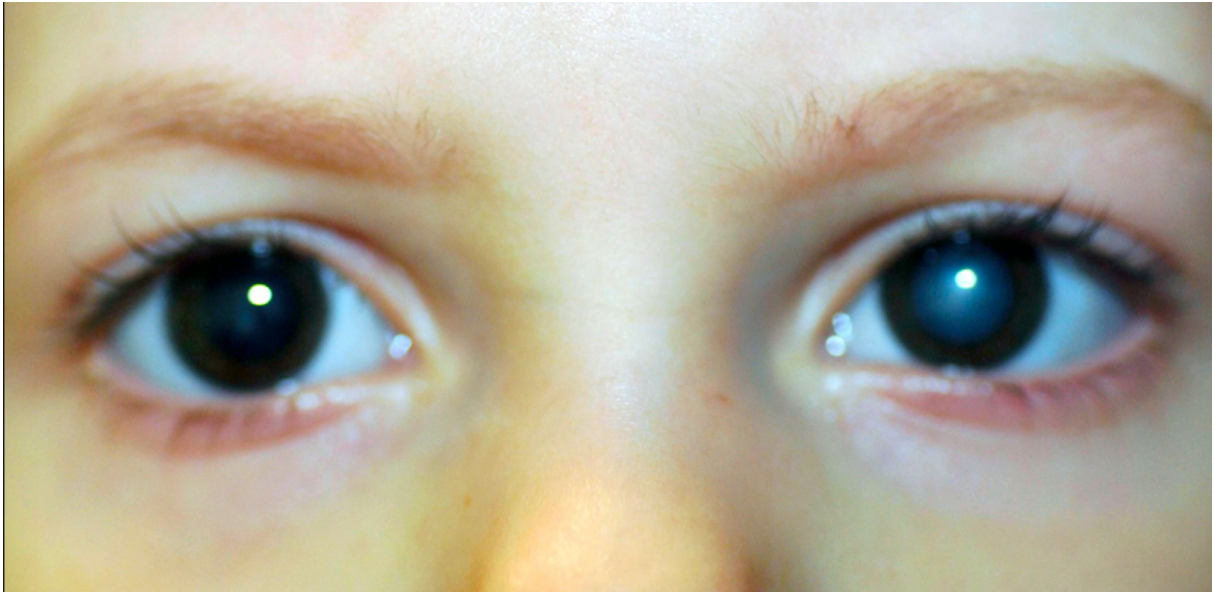
Fig 1 : Reflets cornéens non centrés : cataracte congénitale des deux yeux surtout visible à gauche