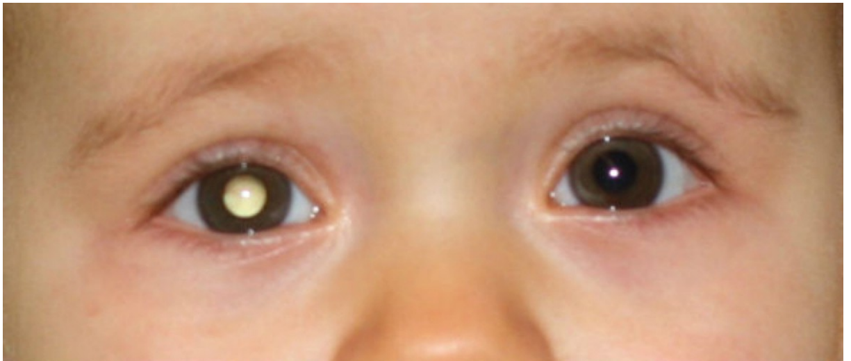
Fig 5 : Cataracte congénitale œil droit.